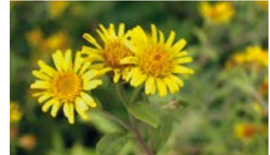
| Inule de Suisse

Le personnel de la Réserve naturelle est chargé de réaliser et coordonner ces opérations