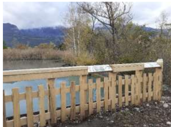
Plateformes d'observation à Chasse Barbier