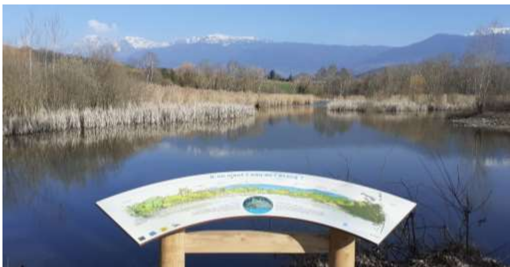
Table de lecture de paysage de la Réserve

Le sentier d'interprétation se poursuit avec 6 bornes pédagogiques et un ponton semi-circulaire pour observer la roselière et découvrir les secrets des plantes aquatiques. Enfin, une table de lecture du paysage permet d'en apprendre davantage sur l'alimentation en eau de l'étang.