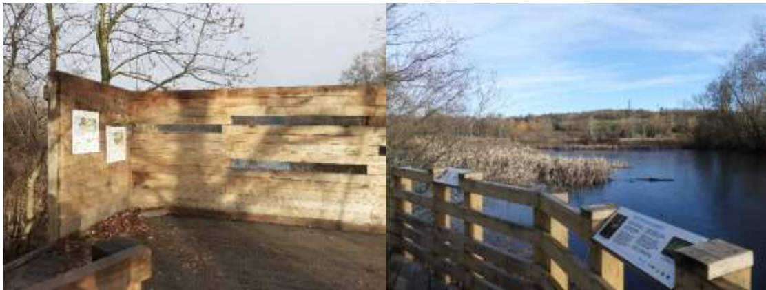
Observatoire et ponton semi-circulaire

6 grands panneaux accueillent le visiteur depuis l'entrée côté bourg, puis le sentier conduit naturellement vers l' observatoire avifaune , rénové en 2021 et accessible par un platelage en bois. Là, 4 panneaux pédagogiques traduits en braille présentent des espèces patrimoniales du site.