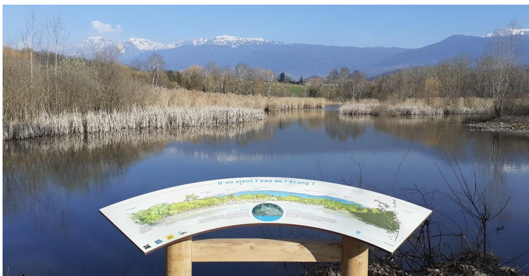
Table de lecture de paysage de la Réserve

Le sentier d'interprétation se poursuit avec 6 bornes pédagogiques et un ponton semi-circulaire pour observer la roselière et découvrir les secrets des plantes aquatiques. Enfin, une table de lecture du paysage permet d'en apprendre davantage sur l'alimentation en eau de l'étang.