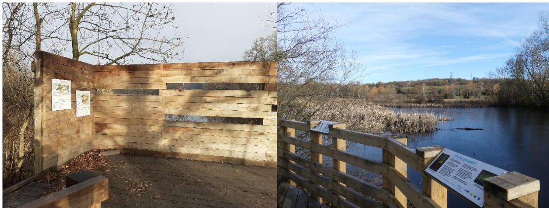
Observatoire et ponton semi-circulaire

6 grands panneaux accueillent le visiteur depuis l'entrée côté bourg, puis le sentier conduit naturellement vers l' observatoire avifaune , rénové en 2021 et accessible par un platelage en bois. Là, 4 panneaux pédagogiques traduits en braille présentent des espèces patrimoniales du site.