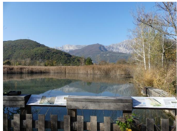
Plateformes d'observation à Chasse Barbier